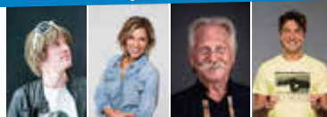
Mickie Krause, Anna-Maria Zimmermann, Henning Krautmacher und Comedian Matze Knop