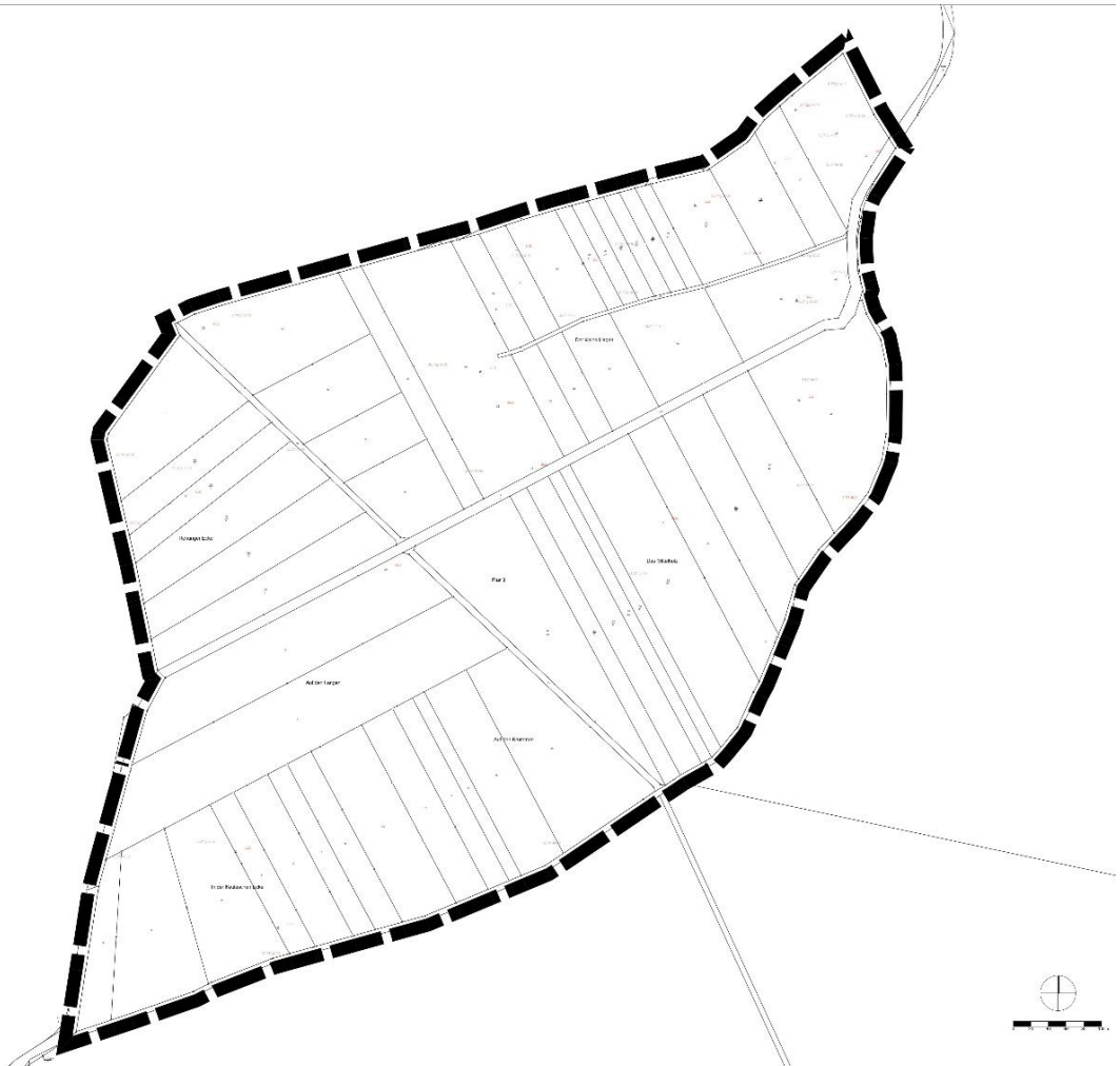
Geltungsbereich im Katasterausschnitt (oben nördlicher Geltungsbereich in der Flur 1, unten südwestlicher Geltungsbereich in der Flur 3)