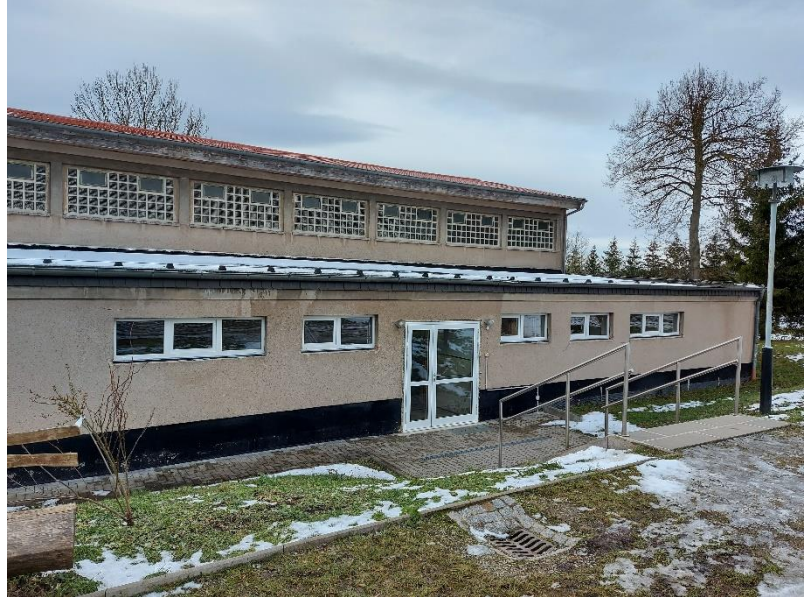
Außenansicht Turnhalle + Sozialtrakt